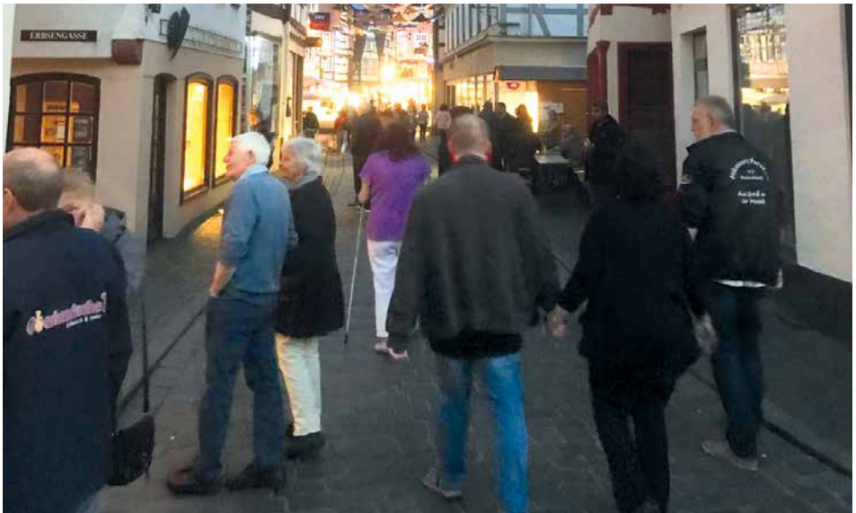
Abendspaziergang über den Gallusmarkt in Büdingen

Im Vorfeld des Konzerts begab sich das Orchester auf ein Probenwochenende nach Büdingen, um dort die Feinheiten der Stücke herauszuarbeiten, aber auch um die Gemeinschaft zu fördern. So wurde freitags und samstags bis abends geprobt, unterbrochen von Mittagessen und Kuchenpause natürlich, und die Abende wurden mit gemeinsamen Spaziergängen über den Gallusmarkt, bei dem auch von einigen Bands Auftritte angesehen wurden, als auch mit einem Quiz gestaltet, sodass für jeden etwas geboten wurde. Die Gemeinschaft an diesem Wochenende wurde somit sehr gepflegt und es hatten alle mitgereisten Musiker sehr viel Spaß. Auch das Konzertprogramm wurde sehr gut vom Dirigenten Jan Henneberger vorbereitet.