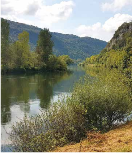
Mit dem Rad entlang dem Fluss Doubs