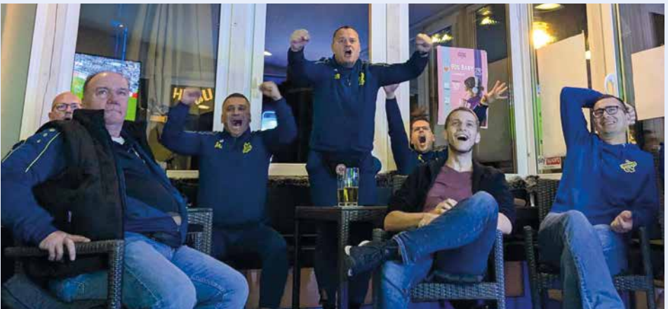
Freude über Tor der SGE in einer Sportsbar