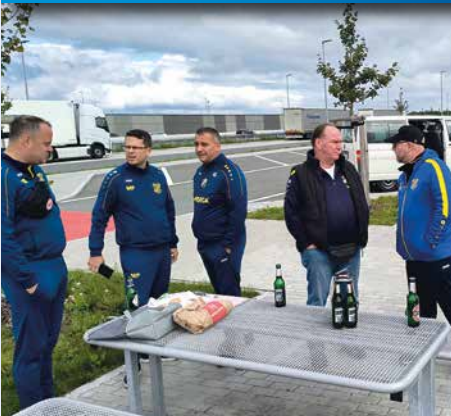
Rast bei Fahrt nach Ingolstadt