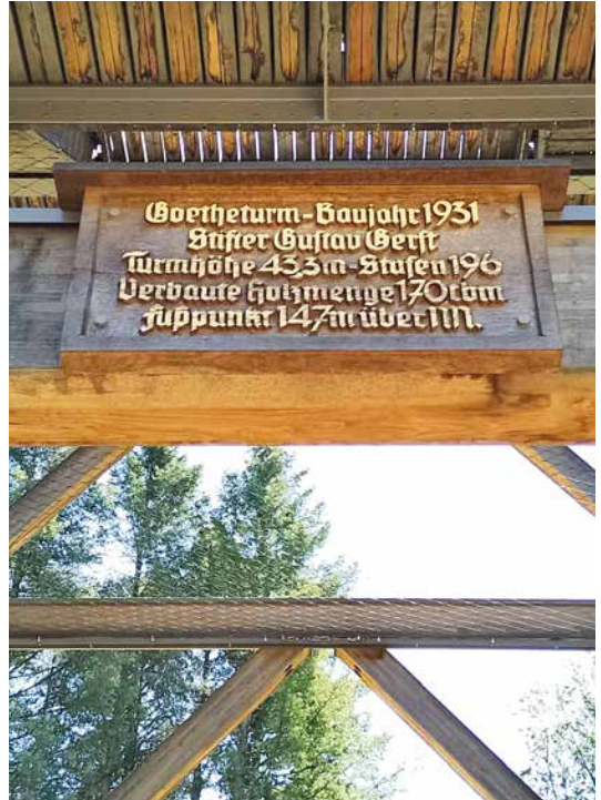
Daten zum Turm