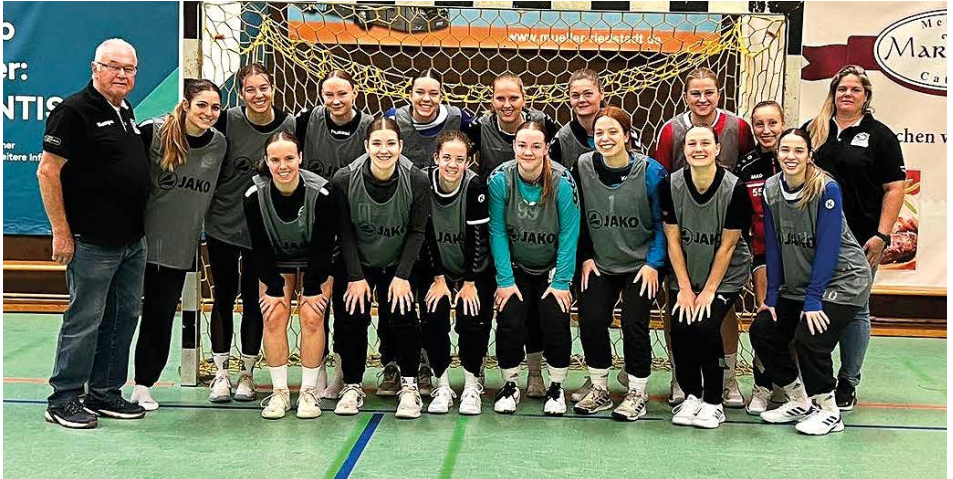
Weibliche D1 mit neuen Leibchen

Durch eine Spende des Landes konnten die Mannschaften der HSG WBW mit Leibchen, Koordinationsleitern und Markierungstreifen ausgestattet werden. Die Koordinationsleiter ist ein elementares Instrument, um die Koordination und die Schnelligkeit zu trainieren. Sie ist ein wichtiger Helfer, um die Grundschnelligkeit und die Auge-Fuß/Bein-Koordination zu schulen.