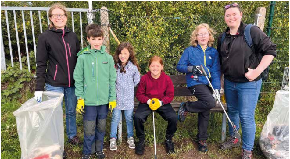
Unsere fleißigen Helfer

Am 19.10. gleich zu Beginn der Herbstferien fand die Weiterstädter Müllsammelaktion statt, an der auch die Ju-Jutsu-Abteilung teilgenommen hatte. Ein kleines Team aus jungen und etwas älteren Ju-Jutsuka sammelte bei bestem Wetter den Müll von Schneppenhausen aus entlang des Weges neben der Landstraße bis zum Bahnhof. Anschließend gab es für die fleißigen Helfer, die noch Zeit hatten, zur Stärkung eine leckere Pizza.