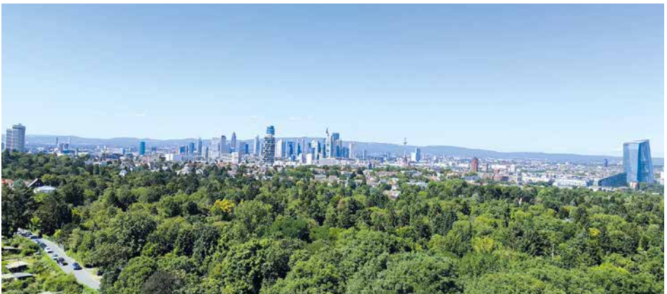
Blick vom Goetheturm