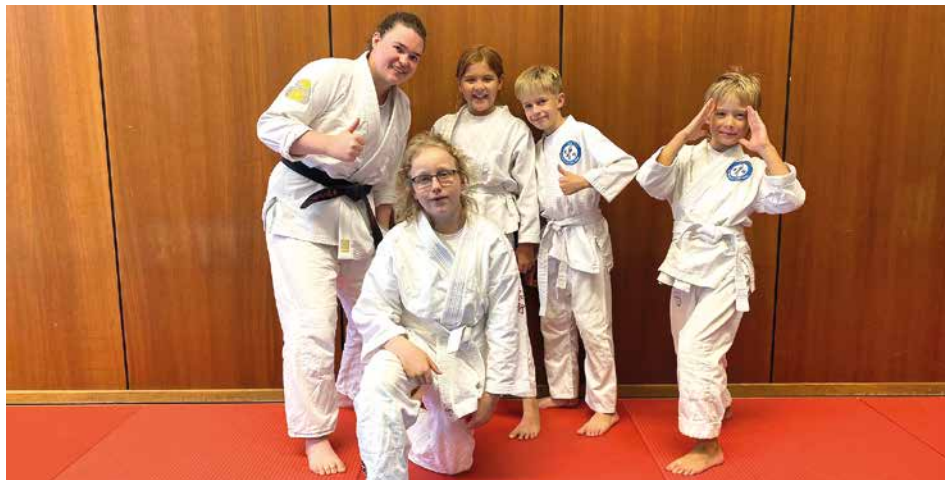
Die Lehrgangsteilnehmer hatten viel Spaß