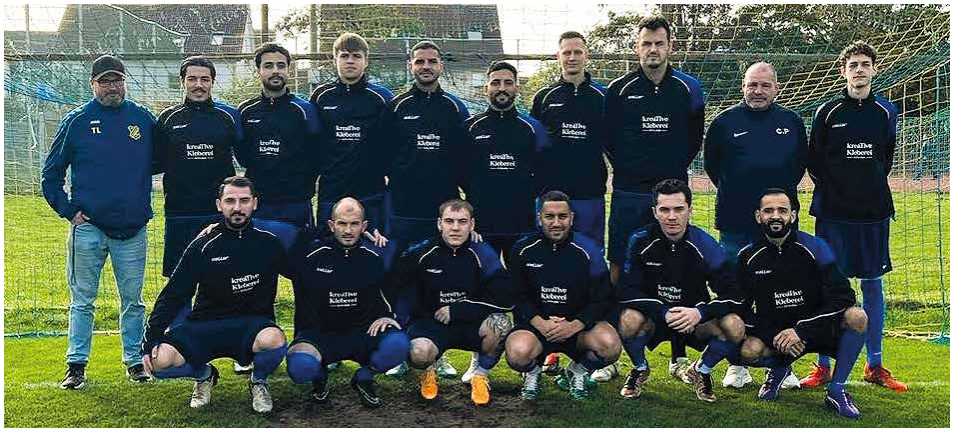
Die 1. Mannschaft mit neuen Aufwärmpullis