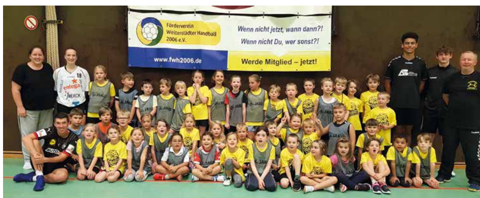
Unsere Minis mit neuen Leibchen

Die Markierungsstreifen sind eine perfekte Lösung für Sportler und Trainer, die Wert auf Qualität und Vielseitigkeit legen. Die Vielseitigkeit der Markierstreifen erstreckt sich über verschiedene Trainingsaspekte, einschließlich Koordination und Dribblings. Ihr robustes Material gewährleistet eine langfristige Nutzung, selbst bei intensivem Training.