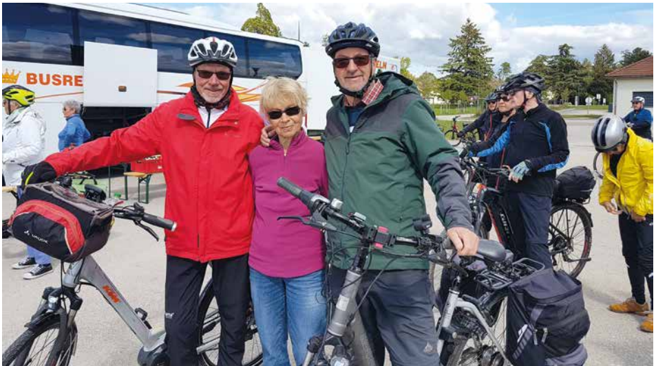
Drei TSV Radler auf Tour in Frankreich

3 TSV-Radler fuhren mit Royal Radreisen bis nach Frankreich in die Stadt Besançon. In 4 Tagen verbrachten sie eine herrliche Zeit mit tollen Radtouren und interessanten Besichtigungen in der Region Franche-Comté, wo auch der bekannte Käse in rund 20 Käsereien hergestellt wird. Wie wir auf einer Führung erfahren haben, darf der Käse nur aus Milch von Kühen der Umgebung hergestellt werden. Auch darf nur eine bestimmte Menge pro Jahr gestellt werden, damit Preise und Wirtschaftlichkeit einigermaßen im Gleichgewicht bleiben. Unsere Tagestouren gingen oft entlang dem Fluss Doubs durch wunderschöne Landschaften. Die Fahrt war ein tolles Erlebnis.