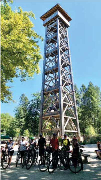
Goetheturm Frankfurt mit 196 Stufen