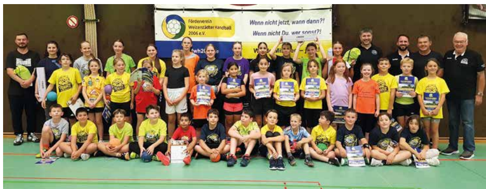
Männliche & weibliche E1, C1 und C2 mit neuen Leibchen und Markierungsstreifen