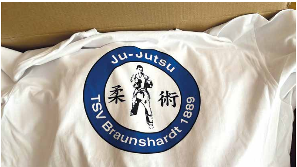
Die neuen Ju-Jutsu T-Shirts mit Aufdruck

Lange hat es gedauert, aber zur großen Freude aller waren sie dann endlich da. Mit Beginn des Trainings nach der Sommerferien-Pause sind unsere neuen Ju-Jutsu-T-Shirts geliefert worden. Viele haben sich ihre Shirts schon abgeholt, auf andere warten sie noch in der Halle zur Abholung.