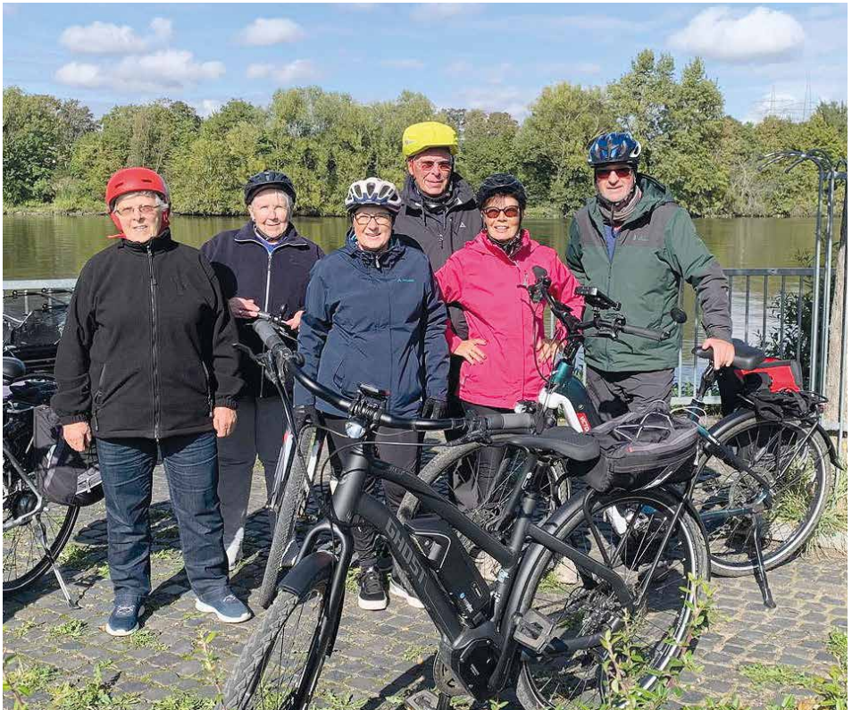
Rast am Main bei Sonnenschein

Ende September ging es über Mörfelden und Mönchbruch zum Bootshaus an den Main. In Rüsselsheim am Main angekommen ging es noch ein kurzes Stück entlang dem Fluss, bis wir dann am Bootshaus waren. Dort haben wir Rast gemacht und sehr gut gegessen. Neben dem Lokal ist die alte Festung, die wir mit dem Rad mehrmals umrundet haben, da es viel Interessantes zu sehen gab. Insgesamt gab es im Jahr 2024 zehn Tagestouren und sechs Abendtouren.