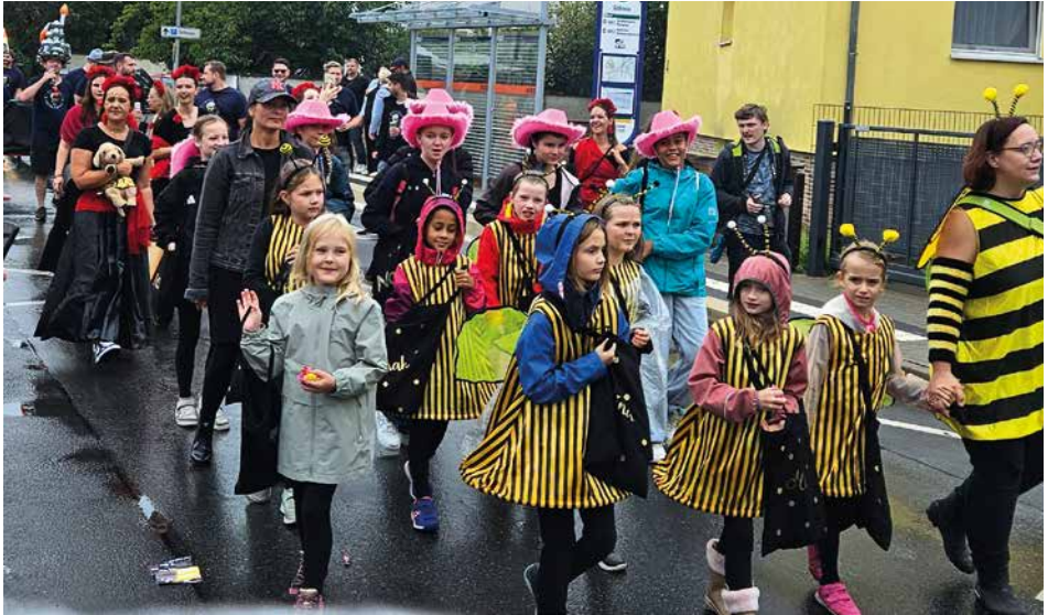
Fröhliche Stimmung herrscht beim Kerweumzug, trotz des regenreichen Wetters.

Alle Gardegruppen trainieren bereits fleißig für die Kampagne 2025.