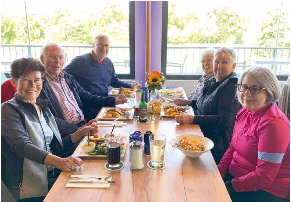
Super Essen im Bootshaus Rüsselsheim

Alle Radler hatten wieder viel Spaß bei dem schönen Hobby und freuen sich auf die Rad-Wanderungen für das neue Jahr 2025. Die Planung dafür erfolgt im Januar und wird in der nächsten TSV Aktuell mitgeteilt. Wie immer gibt es neben den bewährten Strecken auch neue Ziele. So wollen wir endlich mal wieder nach Bodenheim und nach Münster bei Dieburg.