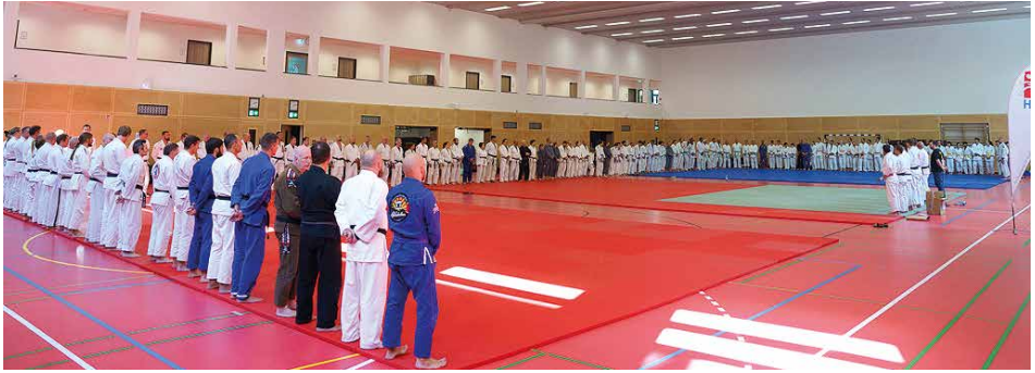
Das Hessenseminar war bestens besucht

Am 19.10. gleich zu Beginn der Herbstferien fand die Weiterstädter Müllsammelaktion statt, an der auch die Ju-Jutsu-Abteilung teilgenommen hatte. Ein kleines Team aus jungen und etwas älteren Ju-Jutsuka sammelte bei bestem Wetter den Müll von Schneppenhausen aus entlang des Weges neben der Landstraße bis zum Bahnhof. Anschließend gab es für die fleißigen Helfer, die noch Zeit hatten, zur Stärkung eine leckere Pizza.