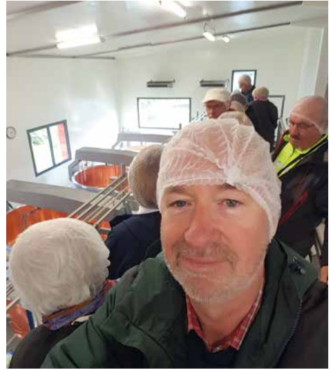
Besichtigung Käserei Comté