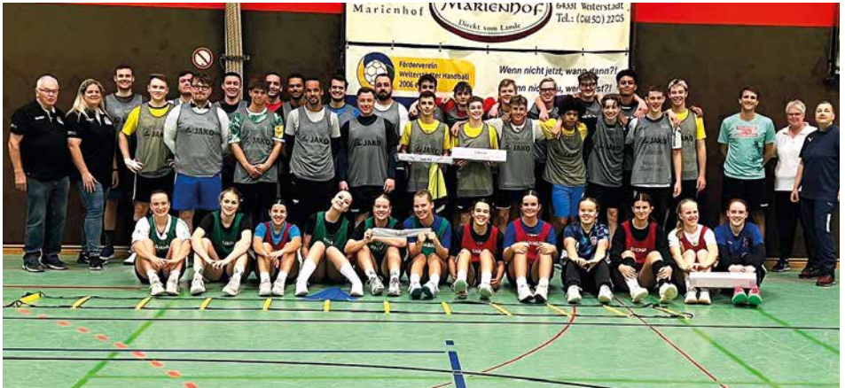
Männliche & weibliche B1 und Herren 1 mit neuen Leibchen und Markierungstreifen